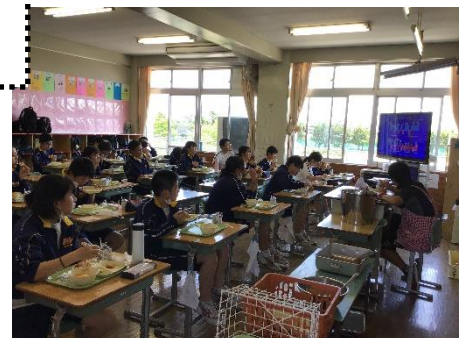
「歯と口の健康週間(6/9)」 給食時間にモニターを使用して。