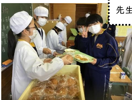
先生方もエプロン・三角巾を着用!