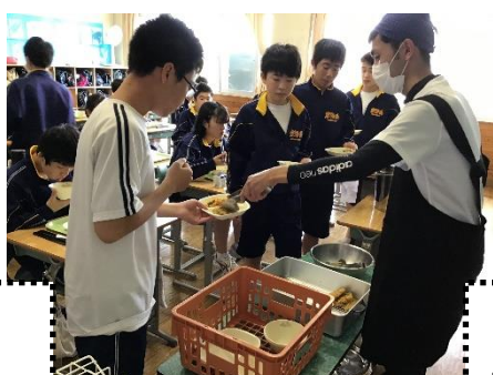
全員、配膳時はマスクを着用!